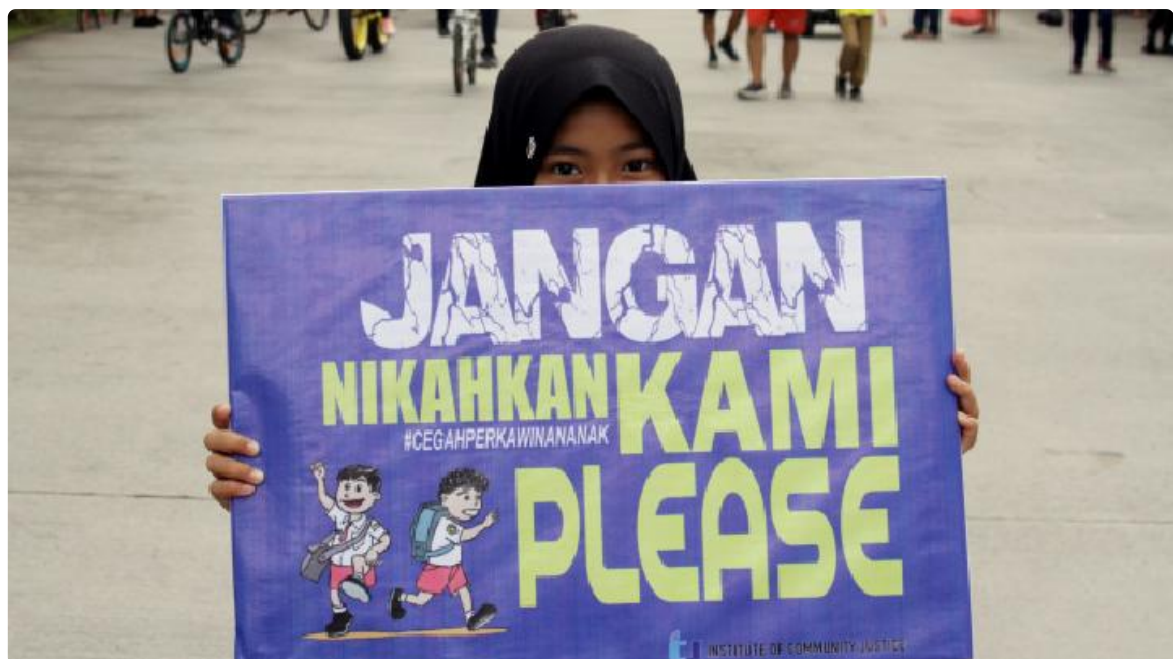
Ilustrasi aksi anti perkawinan anak.

Arri menekankan bahwa perkawinan anak dapat mengakibatkan berbagai macam dampak negatif pada anak perempuan. Misalnya saja dari segi biologis. Ketika perempuan menikah di usia anak, ia akan mendapatkan risiko komplikasi pada kehamilan. Komplikasi ini dapat hadir dalam bentuk persalinan macet hingga konsekuensi kesehatan pada bayi. Sementara itu, aspek psikologis dari anak perempuan ini akan banyak terganggu.