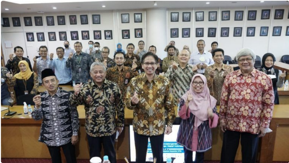
Foto bersama pimpinan ITS beserta jajarannya dengan pimpinan Kementerian Keuangan Republik Indonesia

ITS yang menjadi inisiator pendidikan pertama di Indonesia, sosialisasi diharapkan dapat dimulai dengan memberikan pemahaman akan tujuan CWL," jelasnya.