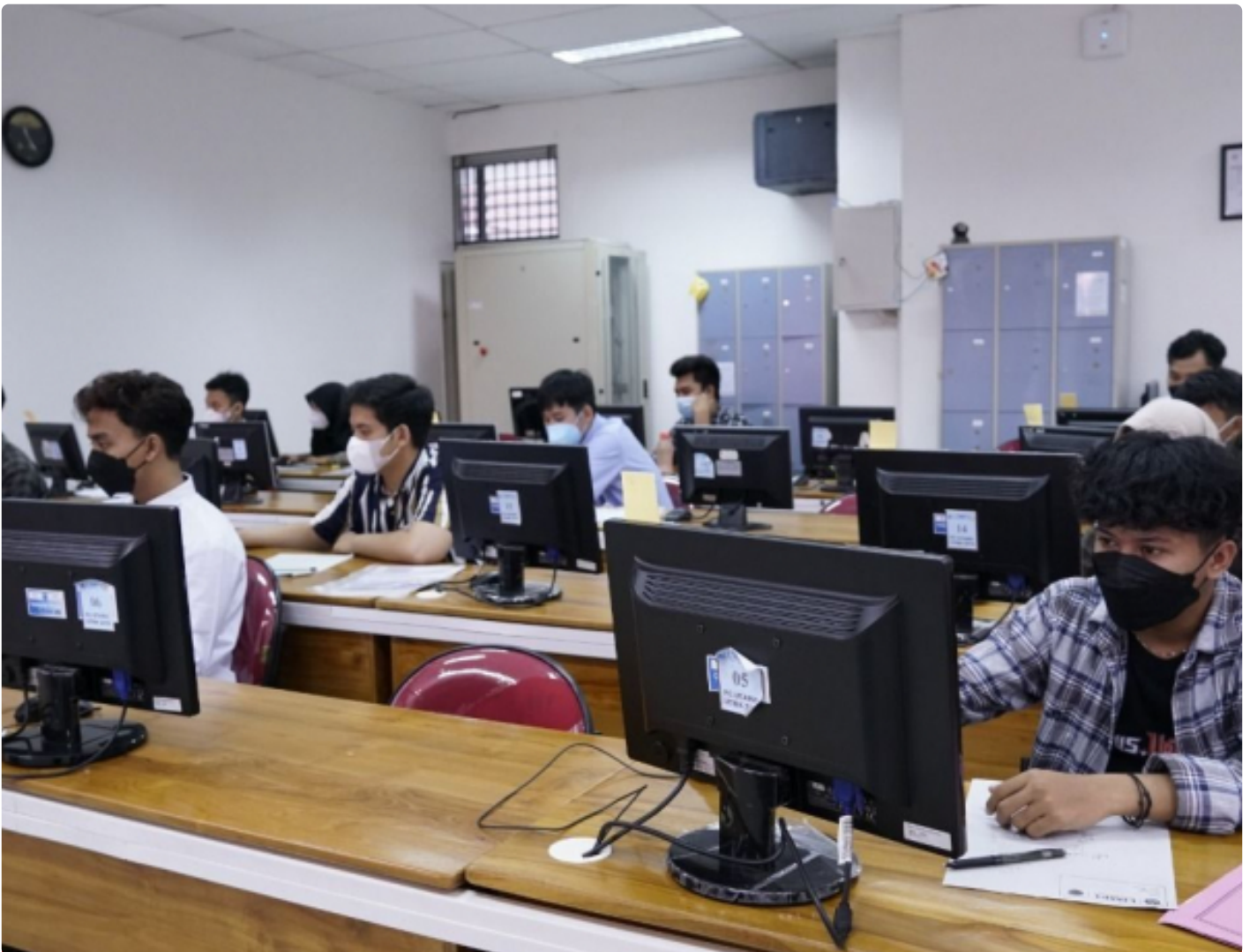
Para peserta UTBK saat mengikuti tes tulis di kampus ITS

SURABAYA – Pengumuman hasil penerimaan Seleksi Bersama Masuk Perguruan Tinggi Negeri (SBMPTN) 2022 telah dapat diakses pada hari ini, Kamis (23/6), pada pukul 15.00. Pada tahun ini, Institut Teknologi Sepuluh Nopember ( ITS ) berhasil meloloskan sebanyak 1.646 dari 19.778 calon